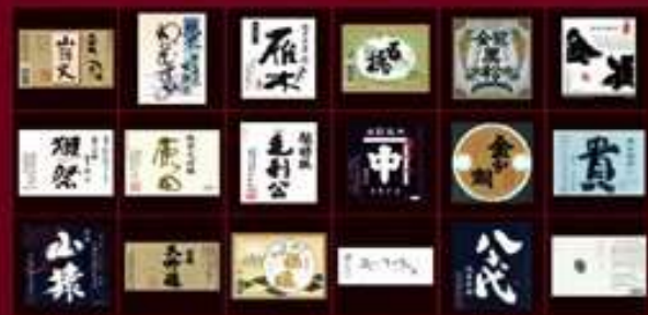
やまぐち食材等提案会 出展企業・商品一覧表