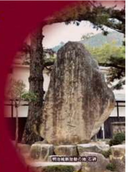
明治維新維新の地 石碑